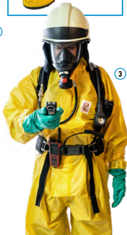
Abb. 6 Anlegen Körperschutz Form 2