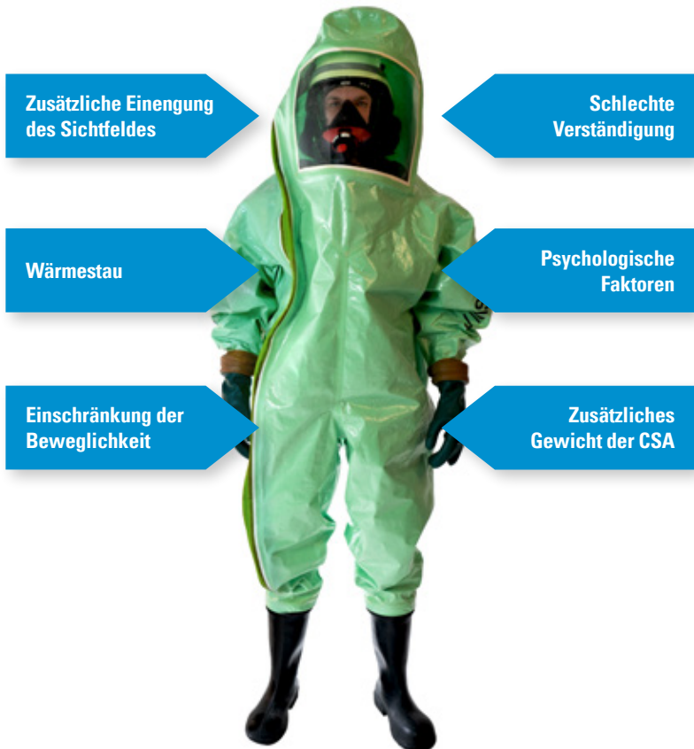
Abb. 5 Belastungen für Körperschutzträger