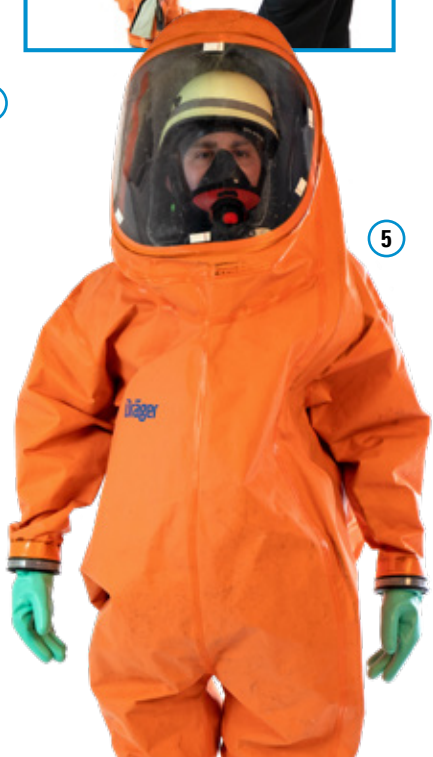
Abb. 8 Anlegen Körperschutz Form 3