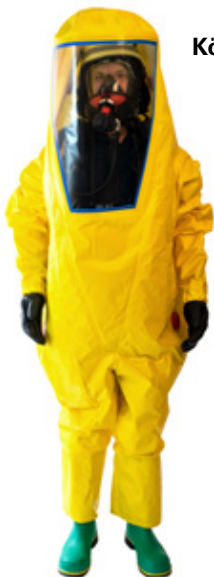
Abb. 3 oben Körperschutz, FFP3 und Augenschutz