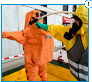
Grobreinigung mit D-Strahlrohr