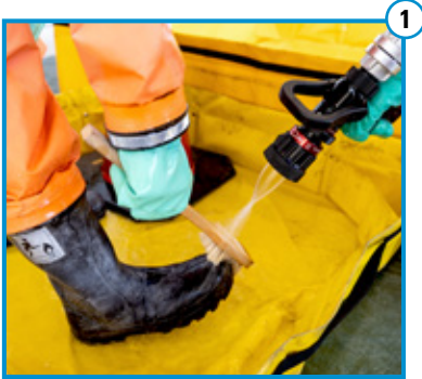
Vorreinigung Stiefel und Handschuhe