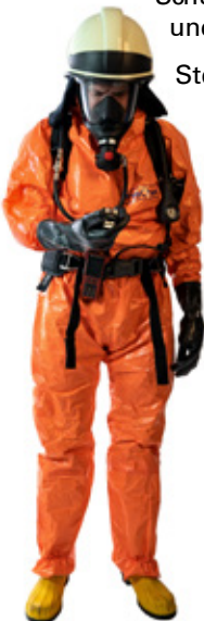
Abb. 1 oben Körperschutz Form 1