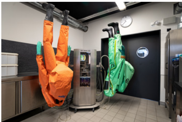
Abb. 10 Atemschutz- werkstatt